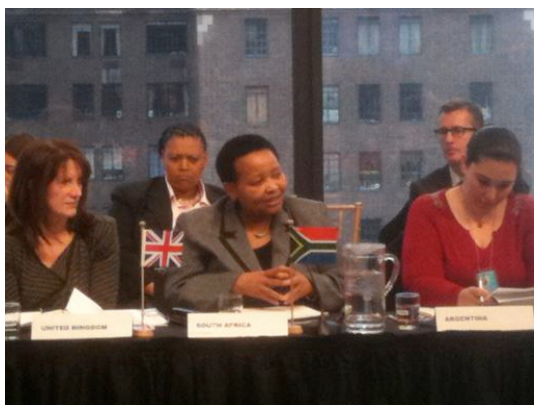
Foto del panel gubernamental sobre "Buenas prácticas": de Der. a Izq., Lynne Featherstone, Ministra de Igualdades, del Reino Unido; Lulu Xingwana, Ministra sudafricana para las mujeres, los niños y niñas y las personas con capacidades diferentes; y, Virginia Giménez, Asesora Legal del Instituto Nacional contra la Discriminación, la Xenofobia y el Racismo (INADI).

Además de lo anterior, el gobierno de los Países Bajos, en colaboración con Noruega, Argentina, Reino Unido y Sudáfrica, patrocinó un muy popular y motivador evento paralelo sobre "Buenas prácticas de políticas gubernamentales". En ambos eventos paralelos, ARC participó con intervenciones sobre la necesidad de mejorar el proceso de documentación y recolección de datos a nivel gubernamental con respecto a las poblaciones LBT.