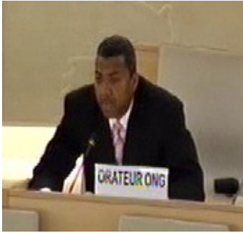
Présentation de Kenneth lors de l'adoption du rapport de l'EPU à la séance plénière du CDH.